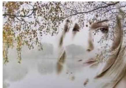
Белла Ахмадулина – «Апрель»

Вот девочки — им хочется любви. Вот мальчишки — им хочется в походы.